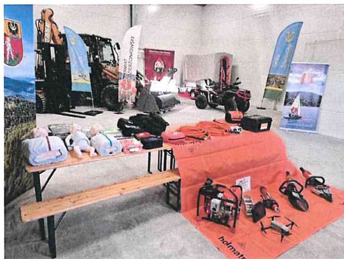
Poglądowe zdjęcia zakupu sprzętu i wyposażenia